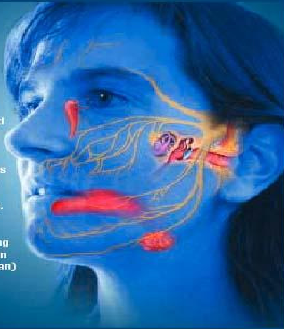
ILLUSTRATION: CLAUDE PAUL

The 7th cranial nerve exits the skull at the stylomastoid foramen, passes through the parotid gland, and subdivides into 5 branches that supply the facial muscles. Paralysis of the nerve may occur without any known cause. Bell's palsy is thought to be caused by swelling of the nerve within the facial (fallopian) canal.